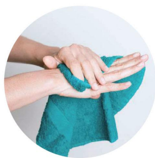
不要與患者共用面巾